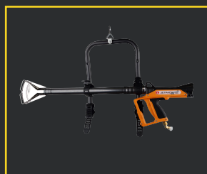
SUPPORT DE TRANSPORT JETPACK