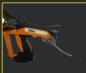
SUPPORT DE BRAS